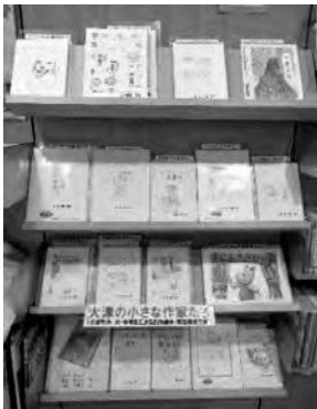
館内カウンターの近くにある創作絵本・物語コーナー (貸出もできます)