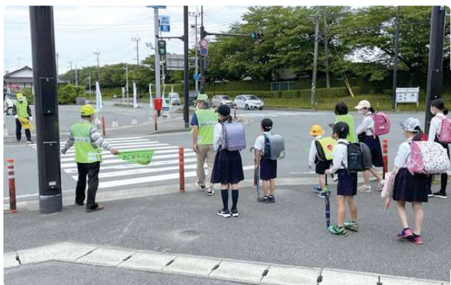
登校時の見守りの様子

近くに、世界最大手の工場が建設されるため、交通量の増加が予想されます。子どもたちの登下校にも大きく影響してくるのではないかと心配しています。今後も、子どもたちの安全を見守っていきたいので、そのためにも、地域の方々のご協力が不可欠です。課題と感じているのは、後継者不足なことです。ぜひ多くのボランティア参加をお願いしたいと思っています。