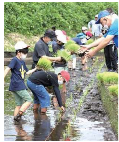
⑤ 苗を渡す係も必要です!

一列に並んで、田植え開始。最初は戸惑っていた子どもたちも、次第に慣れ、どんどん植えていきます。植え終わったら、すぐ傍に流れる