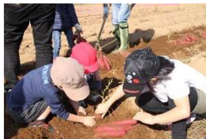
からいもフェスティバル

つつじ祭、からいもフェスティバルなどの企画運営を行っている「明日の観光大津を創る会」へ事業費の助成を行います。