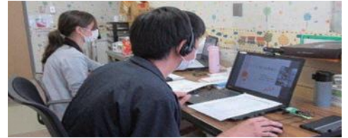
▲感染対策の為、今回はオンラインで開催しました。

参加者からは「他の学校ではどのようなボランティア活動が行われているか」等の質問があり、各学校での活動について情報交換を行いました。今後も各ボランティア協力校と連携しながらボランティア活動の推進を図ってきたいと思います。