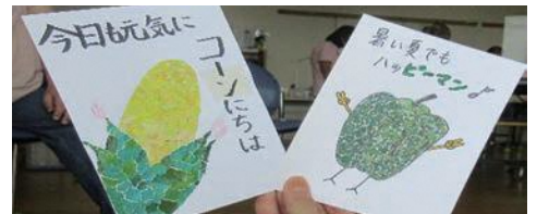
▲施設利用者への残暑見舞いカードの作成等、ボランティア協力校では様々な活動に取り組まれています。