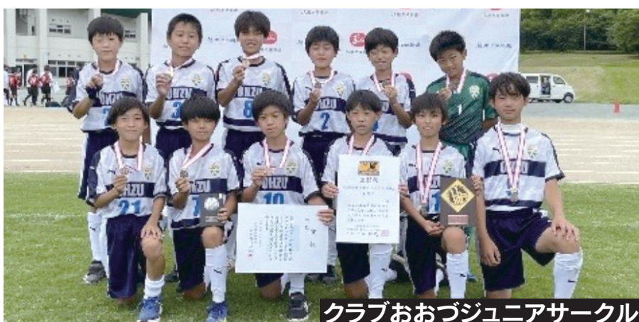
クラブおおぶジュニアサークル