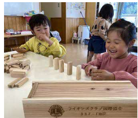
▲積み木遊びとしても楽しまれています

今後は子どもたちが楽しく遊んでくれることで笑顔と知育に繋がるようにと願いが込められています。