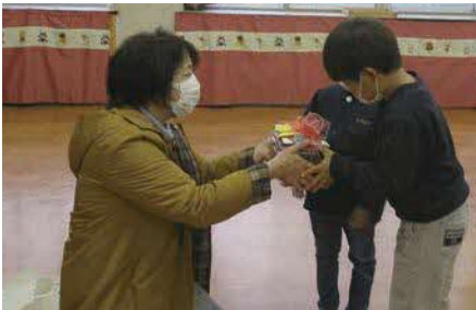
▲町内高校生が作成したクリスマスカードを町内保育園へ