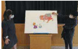
パネルシアターの様子