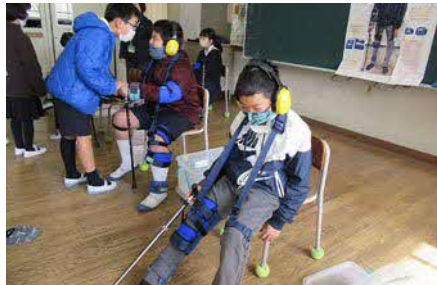
▲町内小学校での高齢者疑似体験