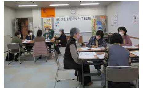
▲音声訳ボランティア