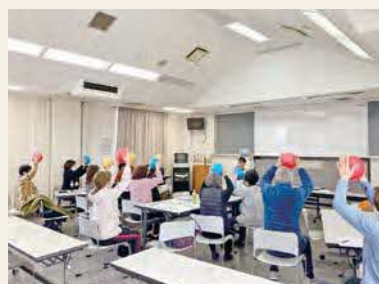
▲ボールを使った運動