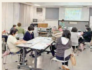
▲食事に関する座学