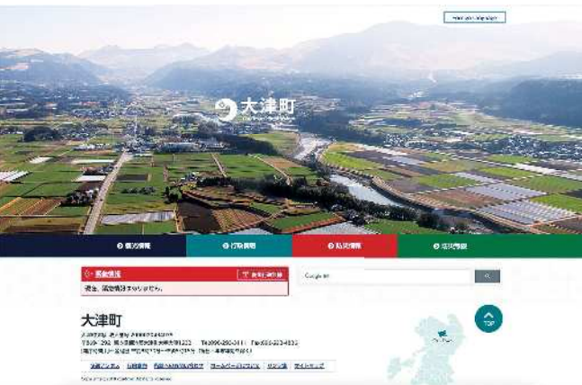
大津町ホームページ