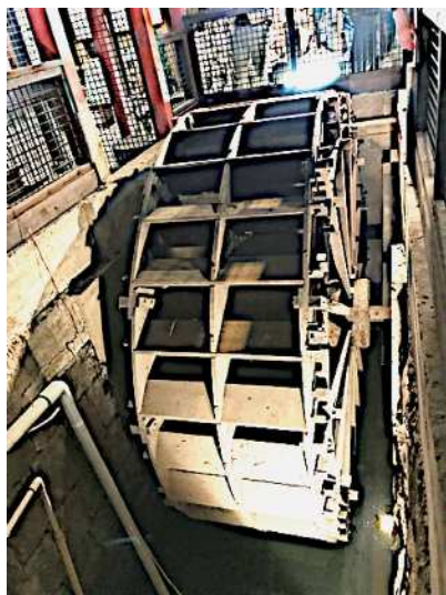
現在も回り続ける貴重な水車