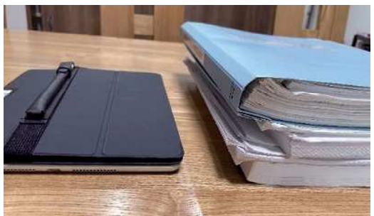
ペーパーレスによる削減のイメージ

紙媒体と併用しながらタブレット操作に慣れ、可能な部分からペーパーレス化を行い、資源および経費の削減に向けた取り組みを進めていきます。 昨年タブレットを更新しファイル共有システムを導入、新庁舎の完成に伴いWi-Fi環境が整備されたことによりタブレットを活用した議会運営について一定の環境が整いました。