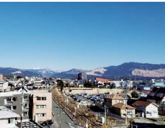
庁舎4階からの眺め

Q TSMCの進出により、今後、高層建築物が増え大津町の景観が損なわれる可能性がある。世界かんがい施設遺産に登録された上井手も、昨年は教育旅行で県外からの学生が訪れている。景観条例を制定することにより①安心安全な生活環境②空き家対策③通学路など生活道路の整備④文化遺産の効率的な活用⑤将来を見据えた都市開発計画⑥阿蘇と熊本を見渡す眺望の保全、以上の効果が期待できる。大津町を魅力的な町にし、活性化させるためには景観保護条例が必要ではないか。大津町は、町全域が都市計画区域となってお