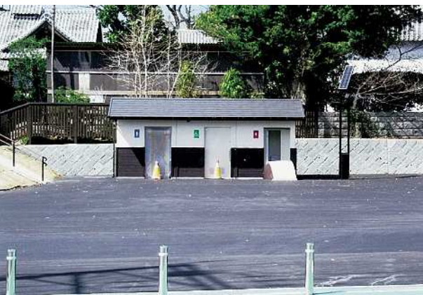
「江藤家住宅」に接する「広場」誕生

Q 「活かした文化財住宅」として令和3年春に主屋が復旧したが、国重要文化財の指定から外れている整備に国、県及び町と個人負担の割合について。