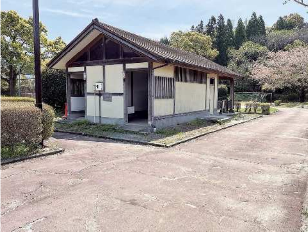
今どき珍しい汲み取り式のトイレ