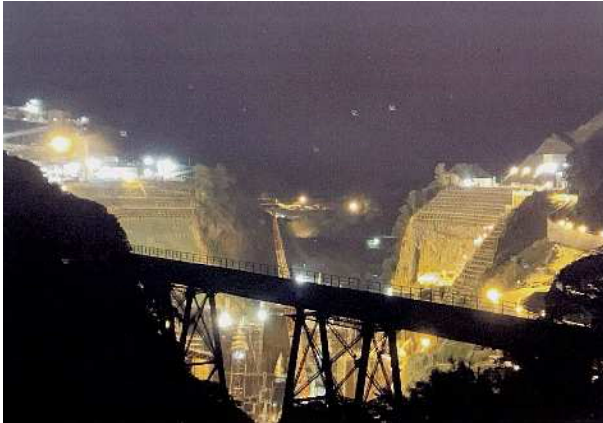
夜間工事中の立野ダム

以前は熊本市龍田から大津町までの国道57号線は大津街道杉並木と言われていたが、菊陽町の強い要望で、今は菊陽杉並木街道と言われている。関係部署に強く要望すべきだ。