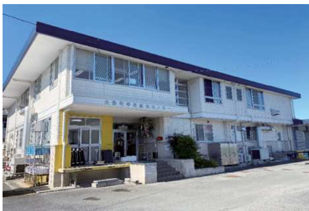
大津町学校給食センター