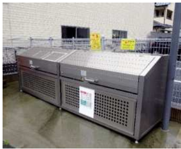
町営住宅に設置された ゴミステーション 市販価格は、 1台20万円前後