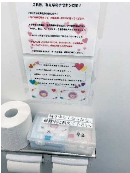
学校トイレ個室に設置された生理用品