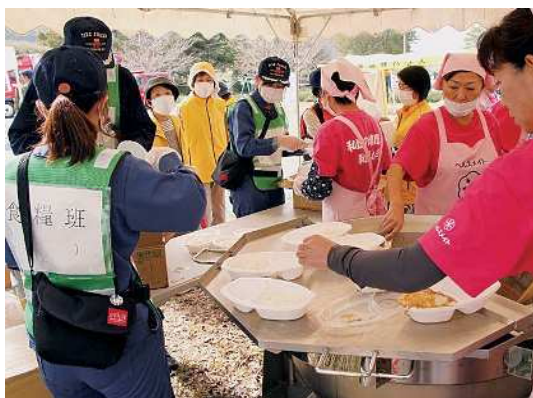
避難所運営訓練に効果的な補助を