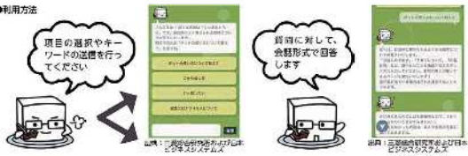
昨年5月頃に行われた実証実験 実験の結果もその後の対応も不明