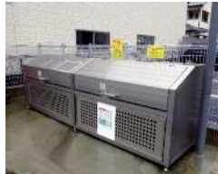
町営住宅に設置されたゴミステーション市販価格は、1台20万円前後