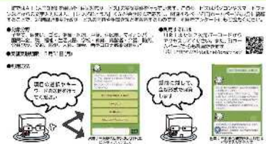
昨年5月頃に行われた実証実験 実験の結果もその後の対応も不明