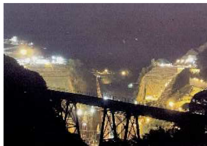
夜間工事中の立野ダム