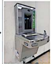
非接触式で感染症予防対応 ※触らずにマイボトルに汲めます！

Q 大津町地球温暖化対策実行計画を、より実効性のあるものにするための取組として、プラスチックを減らすために、マイボトルへ直接、冷水を入れてられる冷水機を、総合体育館や庁舎などの公共施設に設置するべきではないか。