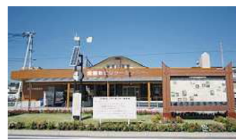
肥後大津駅南口の活性化を

肥後大津駅の観光拠点活性化は ① 来年3月に阿蘇熊本空港の新空港ビルがオープンするが、駅活性化に関連し補助金の活用は出来ないか。 ② また、駅のビジターセンターに町内店舗情報やイベントの案内等ももっと強くアピールできないか。 ③ 県交通政策課等へアプローチし、空港新ビルに連動した企画を検討する。映像広告を設置し観光案内する企画も考えている。回遊性を高めるよう取り組む。