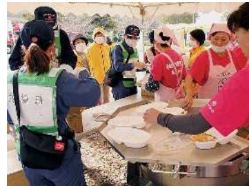
避難所運営訓練に効果的な補助を

Q 災害時避難所の指定は災害対策基本法第49条に定める市町村の義務行為であり、避難所の運営主体は防災計画で地域のコミュニティとしている。役場職員が24時間体制で避難所に常駐するのは本来の業務を阻害する。避難所生活は、コミュニティの濃縮と考えると、命を守る自主防災組織の避難所運営訓練が必要だ。