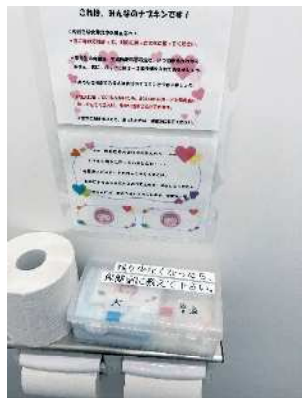
学校トイレ個室に設置された生理用品