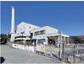
解体予定の東部清掃工場

旧清掃工場の解体スケジュールは ① 東部清掃工場については解体後土地が町に返還される事になっているがスケジュールは。また管理する事務組合が変わるため、書面等を作成しておく必要はないか。 ② 解体費用は8億円必要で、2市2町で積み立てを行っている。解体にかかる工事設計を令和6年度、解体工事を令和8年度までに行う予定となっている。 ③ また事務組合と協議書を作成し、それをもとに必要な協議を行い手続きに漏れないようにする。