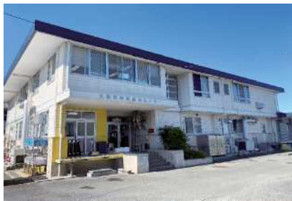
大津町学校給食センター

Q 近隣自治体と比較し給食費が安いとされているが、今後ともTSMCの進出などで人口増加も予想されるが、現在のセンターだけで十分な対応が可能なのか。